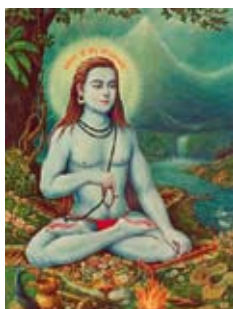
Baba Siri Chand 1494-1643

Du ansöker genom skriftlig anmälan på bifogad ansökningsblankett eller ladda ner ansökan från våra respektive hemsidor. Ju tidigare du skickar in din ansökan desto större chans att du får en plats på utbildningen. Vi skickar ut en bekräftelse på att vi fått din ansökan via e-post. Sista ansökningsdatum för Göteborg är 30 juni 2012 och för Malmö 30 juni 2013.